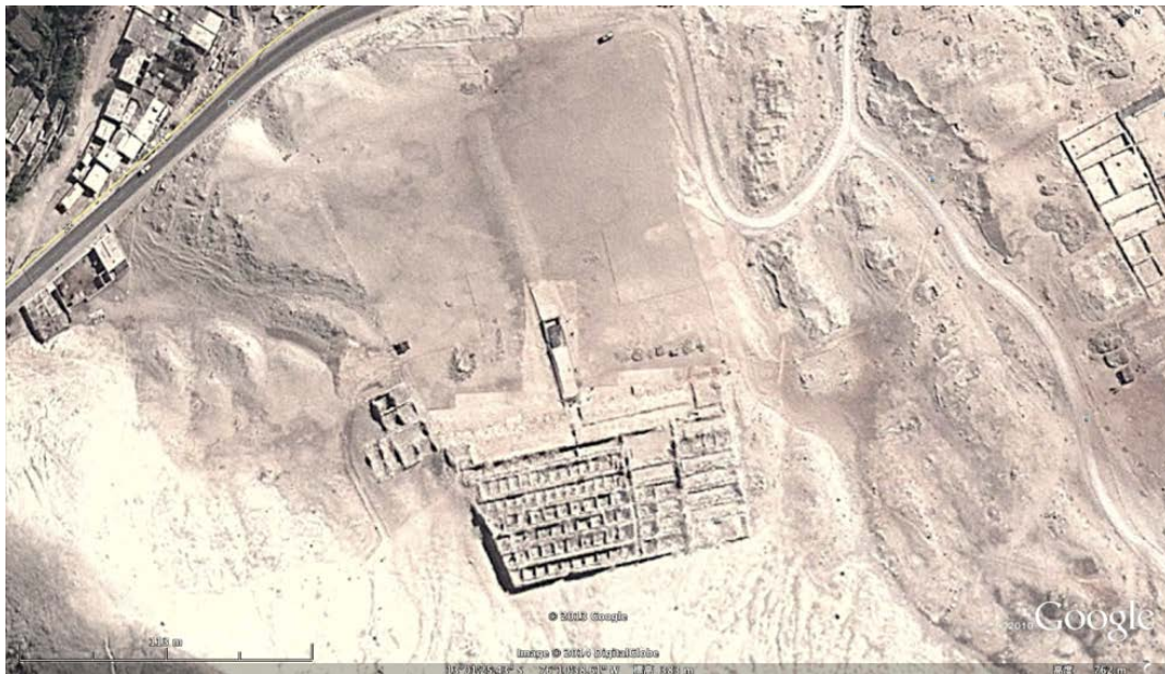
Inca Wasi, un santuario de los Incas, se cree que es un calendario.

Por un lado lo más notable de la cultura Nazca son los geoglifos construidos en las pampas del mismo nombre, siendo los más conocidos el colibrí, la araña y el mono. María Reiche, matemática alemana que le dedicó 50 años de su vida al estudio y preservación de las líneas de Nazca, llegó a la conclusión que es un gigantesco calendario agrícola relacionado a los movimientos del sol, la luna y las constelaciones. (Wikipedia)