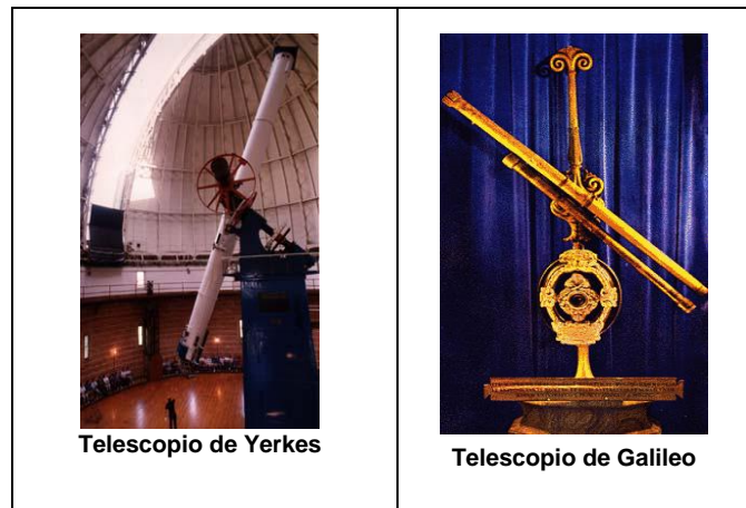
Telescopio de Yerkes

Hay dos tipos de telescopios: el refractor y el reflector. El telescopio refractor está formado por dos lentes, una de pocos aumentos, que se llama objetivo, y otra de muchos aumentos, que se llama ocular.