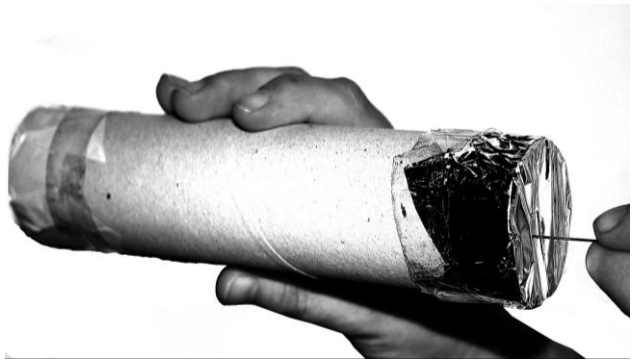
Fig. 12 y 13: Modelos de cámara oscura

Para calcular el diámetro del Sol, basta considerar la figura 14, donde aparecen dos triángulos semejantes